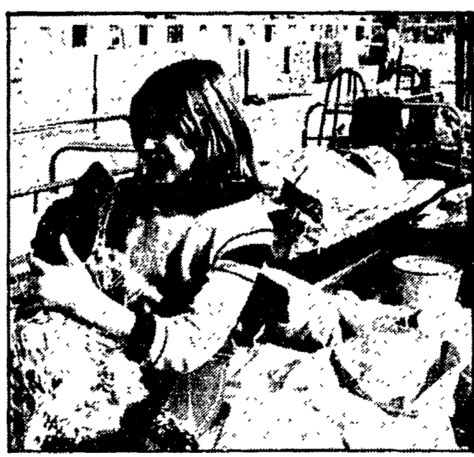
A Gazli dopo il terremoto