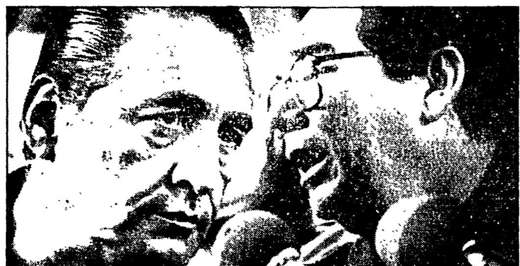
SAN SALVADOR - José Napoleon Duarte, a sinistra, in un momento della conferenza stampa a commento dei risultati del voto di domenica

SAN SALVADOR - I risultati delle elezioni di domenica non sono ancora noti.