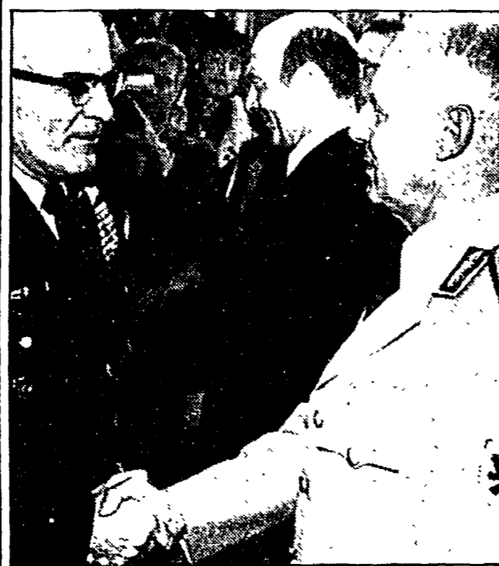
Sorrisi per Kiessling che se ne va

datto a svolgere una complessa azione in campo internazionale, sia perché il dare vita ad un nuovo organismo burocratico rischia di fare perdere un lungo tempo.