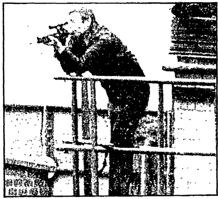
alla Spaghetti House di Knightsbridge (1976)...