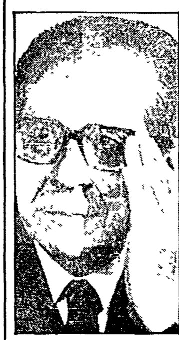
Hernan Siles Zuazo

Una contesa per l'assegnazione di 1200 mitra inviati da Parigi sarebbe all'origine della tensione tra le forze armate