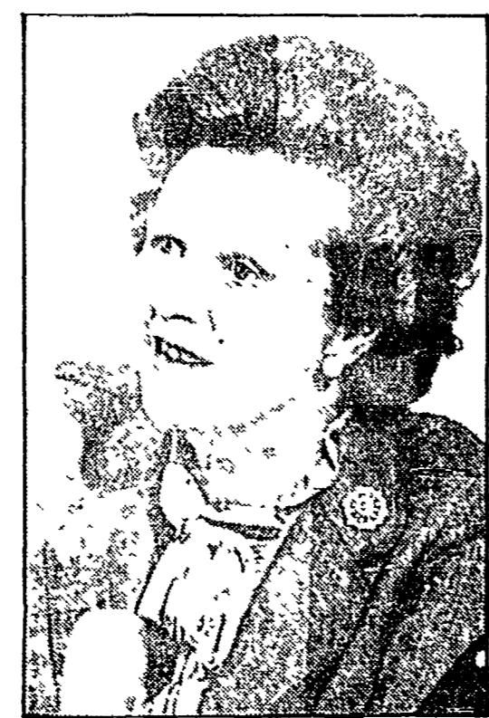
Margaret Thatcher e Moammar Gheddafi

Le dichiarazioni dell'ambasciatore italiano si segnalano per il loro equilibrio e la precisa volontà di contribuire alla distensione... Le dichiarazioni dell'ambasciatore italiano si segnalano per il loro equilibrio e la precisa volontà di contribuire alla distensione.