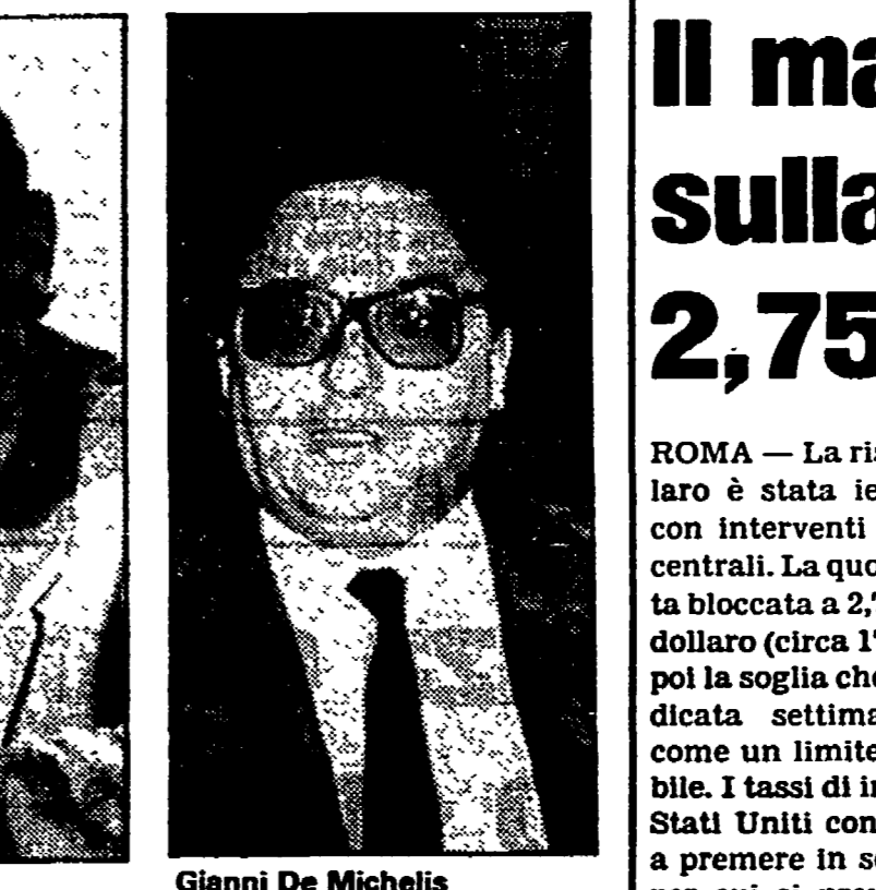
Gianni De Michelis