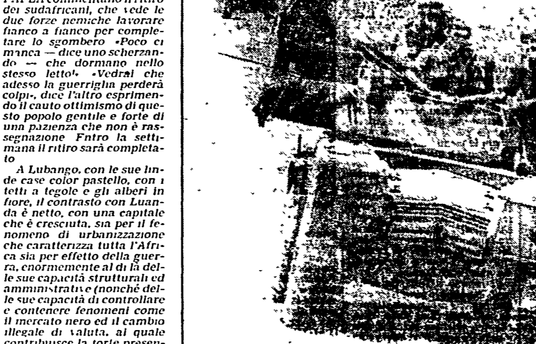
JOHANNESBURG — Soldati sudafricani impegnati nelle operazioni militari nel sud dell'Angola