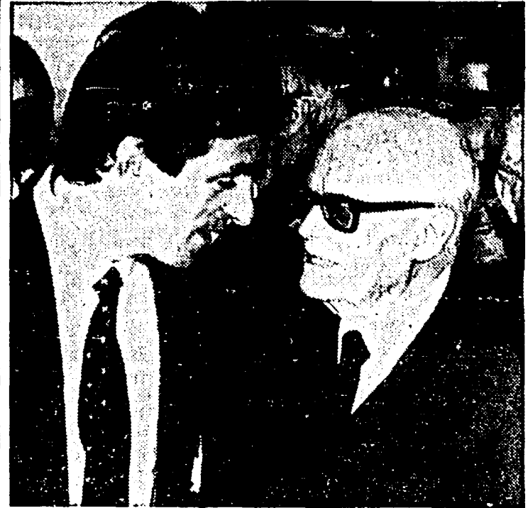
A Ferrara Pertini «maglia rosa»

TORINO - È nata 80 anni fa. Dall'altro ieri il suo nome è affisso nella bacheca della scuola media statale «Albert Schweitzer»... «Continuerò gli studi»