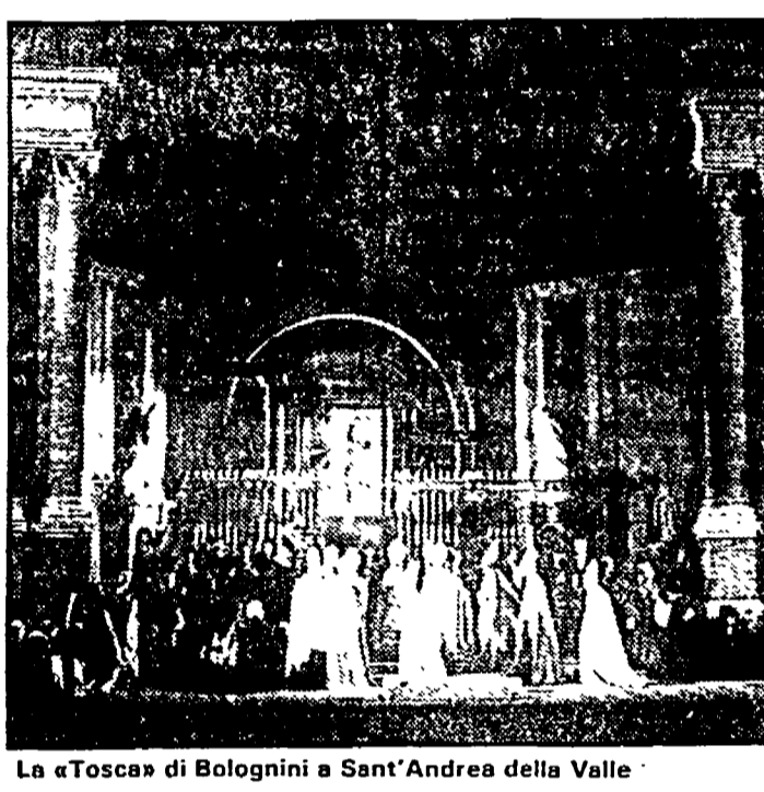
La «Tosca» di Bolognini a Sant'Andrea della Valle

Le repliche sono previste per i giorni 13, 15, 21, 24, 27 e 29 luglio. È questo il secondo anno che «Tosca» compare nel cartellone di Caracalla.