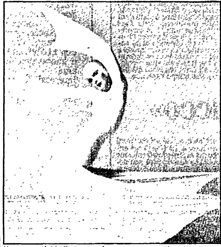
Una scena del balletto americano

Respira la musica nel Lazio, propongono l'Accademia di Santa Cecilia e il Cts. Così dopo Bracciano è la volta di Toscana, dove la «comitiva musicale» si sposterà domani. Per iscriversi bisogna recarsi alla sede del Cts, in via Genova 16, entro le ore 13 di oggi. Per Toscana, si parte alle ore 16, si arriva nella neopolitrietrusa per un giro, quindi si visita il centro storico medievale e infine si visitano le chiese di San Pietro e Santa Maria Maggiore. Il concerto è eseguito dal «David Short Brass Ensemble».