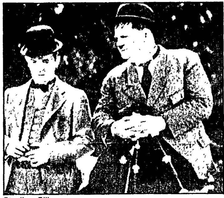
Stanlio e Ollio

La miglior difesa è nella paura (Laerte). Schermo grande: "The day after..."