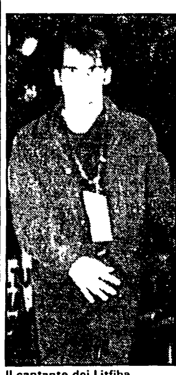
Il cantante dei Litfiba

Un'altra replica de "Le nozze di Figaro", di Mozart, proposta dall'ambito del Rome festival.