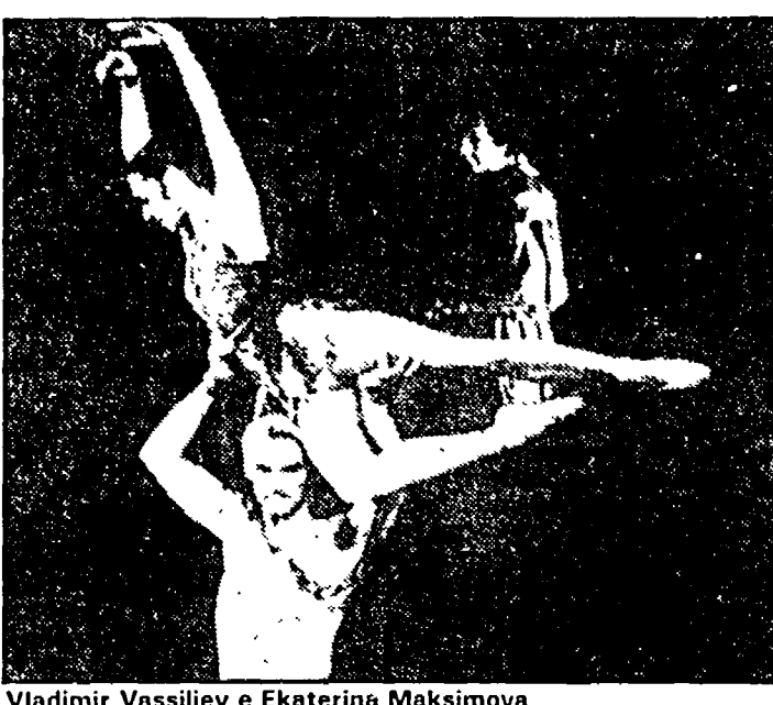
Vladimir Vassiliev e Ekaterina Maksimova

Al Parco dei Daini, questa sera, replica della rassegna di balletto dedicata alle stelle del Bolscioi.