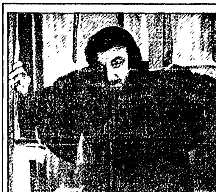
Lino Ventura e Jean Valjean nel «Miserabili»

FIRENZE — Si è aperta ieri a Livorno, nei locali del Centro Donna, «Oltre la posa: immagini di donna nell'archivio Alinari», una mostra fotografica curata dalla Libreria delle Donne di Firenze, che resterà aperta fino al 23 settembre 1984. È disponibile il catalogo. Circa 100 foto di donne scattate tra il 1860 ed il 1910 sono presentate in questo allestimento che pur volendo documentare un periodo storico ed una certa immagine della donna ad esso legata, non si propone come mostra-galleria. Il desiderio di andare — come il titolo indica — oltre la posa ha prodotto infatti una mostra singolare ed interessante, che non sacrifica in nome dell'oggettività dell'immagine lo sguardo di chi l'ha scelta e cerca anzi di testimoniare tutta la parzialità.