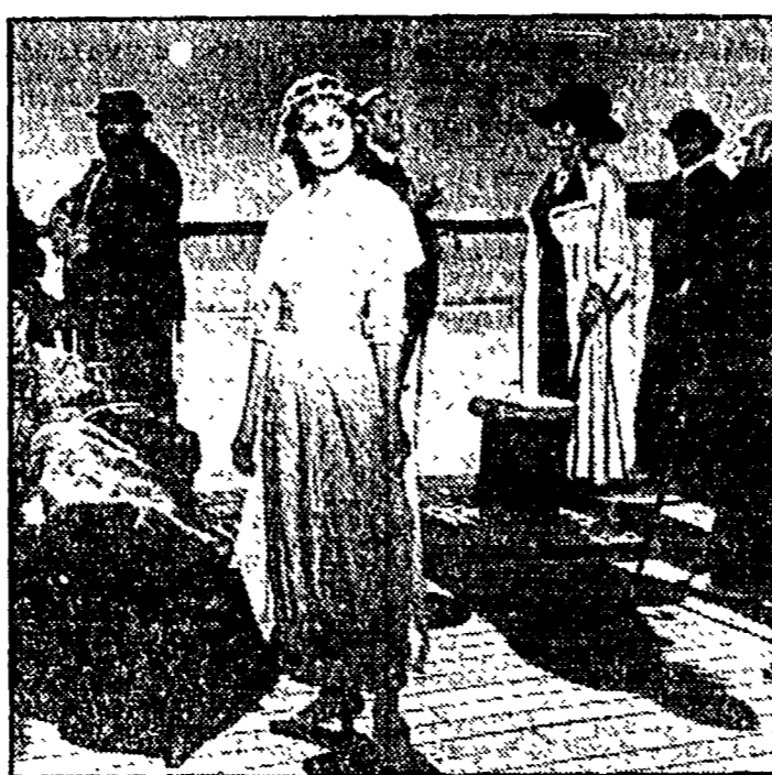
Corrado Ruggeri Una sequenza della «Nave» di Fellini