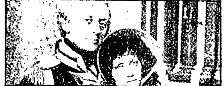
«Nelsona su Raiuno alle 20.30»