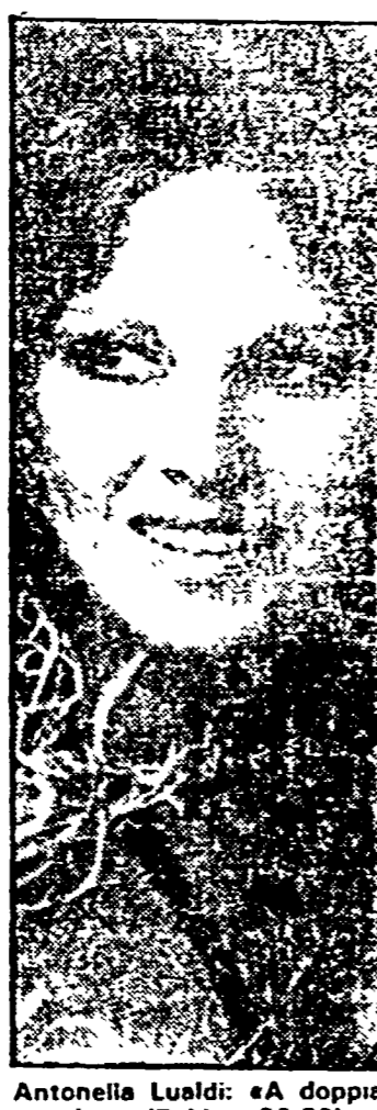
Antonella Lualdi: «A doppia mandata» (Raidue, 20.30)