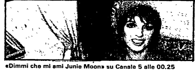
«Dimmi che mi ami Junie Moon» su Canale 5 alle 00.25