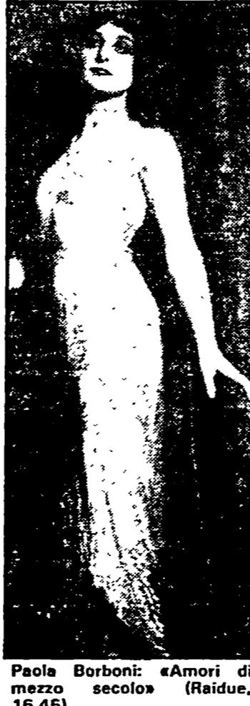
Paola Borboni: «Amori di mezzo secolo» (Raidue, 16.45)