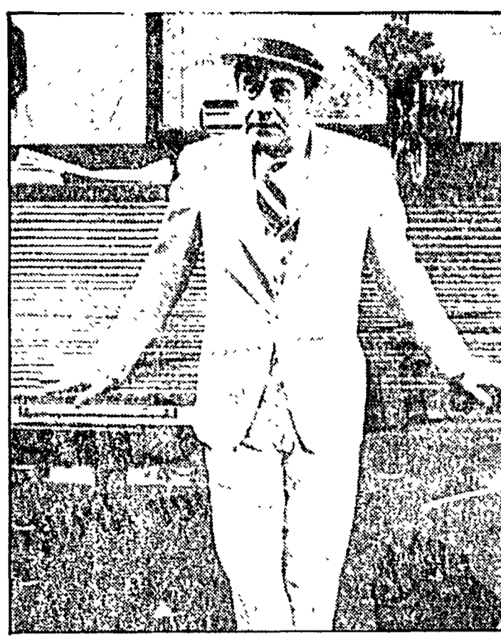
Jack Lemmon in «Prima pagina»

vivere» di Ernst Lubitsch. Lunedì il programma non è più quello previsto: al posto di «Show people» di King Vidor «Servo di scena», in versione originale con sottotitoli, e «Tootsie» e «Rita, Rita, Rita».