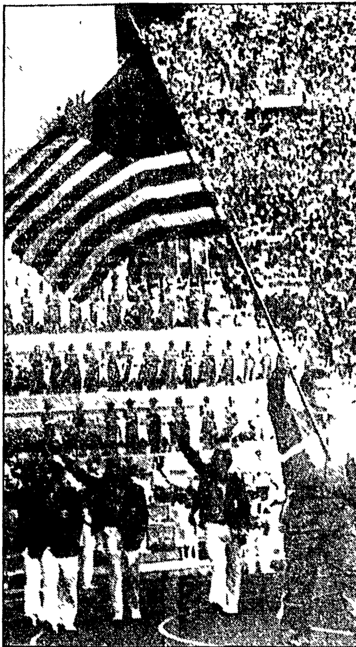
Il martellista Usa Ed Burke portabandiera nel Coliseum