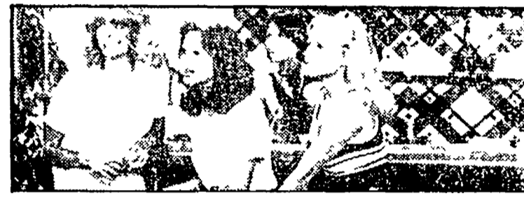
«Charlie's Angels» su Retequattro alle 20,25

RADIO 1 GIORNALI RADIO 6.55 7.30 7.55, 8.20, 12, 13, 19, 22.55 On- da verde 6.55, 7.55, 22.55, 6 Combinazione musicale; 8.20 Olym- piadi; 11 «Divertimento 1889»; 11.20 I fantastici anni 50; 12 La voce delle stelle; 13.15 Olimpiadi; 13.25 Master; 15 Raduno per tut- ti; 16 Il pagnone; 17.30 Raduno Ellington; 18.05 60 anni di radio; 18.30 Musica sera; 19.15 Olimpia- di; 19.20 Ascolta si fa sera; 19.25 Audiodischi; 20 «L'aula bruciata»; 21.45 Il box della musica; 22 I fan- tastici anni 50; 22.35 Autoradio flash; 22.40 Oggi al Parlamento; 23.05 La telefonata RADIO 2 GIORNALI RADIO 6.30 7.30 8.30, 9.30, 10, 11.30, 12.30, 13.30, 16.30, 17.30, 18.30, 19.30, 22.30, 6 I giorni; 8.05 Sin- tesi dei programmi; 8.45 «Soap ope- ra all'italiana»; 9.10 Vacanza pre- mio; 10.30 «Ma che vuoi?»; 12.10 Programmi regionali; 12.45 «Ma che vuoi?»; 13.50 Olimpiadi; 14 Pro- grammi regionali; 15 C'era anch'io; 15.30 Media delle valute; 15.40 Estate attenti; 19 Arcobaleno; 19.50 DSE Fiaba e folklore; 20.10 Helzapoppin; 21 Canta uomo, canta 22.20 Panorama parlamentare; 22.30 jazz RADIO 3 GIORNALI RADIO 7.25 9.45 11.45, 18.45, 20.45, 7.25 Prima pagina; 8.30 Concerto del mattino; 9.45 Il cibo dei sentimenti; 11.45 Pomeriggio musicale; 15.15 Cultura; 15.30 Un certo discorso estate; 17 C'era una volta; 18.45 Spazio tre; 21.10 Rassegna delle riviste; 21.10 Pe- spazio 50 anni per la musica; 22.15 Spazzotti opinione; 23.10 jazz; 24 Il notturno