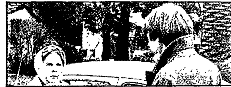
«Harold e Maude» su Raiuno alle 21,30

RADIO 1 GIORNALI RADIO 6.55 7.30 7.55, 8.20, 12, 13, 19, 22.55 On- da Verde 6.55, 7.55, 22.55, 6 La combinazione musicale; 8.20 Olimpiadi; 11 «Divertimento 1889»; 11.20 I fantastici anni 50; 12 La voce delle stelle; 13.15 Olimpiadi; 13.25 Master; 14.30 Parlamo di montagna; 15 Raduno per tutti; 16 Il pagnone estate; 17.30 Ra- duno Ellington '84; 18 Europa spettacolo; 19.30 Moda e maniera; 19.15 Olimpiadi; 19.20 Ascolta si fa sera; 19.25 Audiodischi; 20 Vita da uomo; 20.30 i concerti da camere; 22.05 I fantastici anni 50; 22.45 Autoradio flash; 22.50 Ieri al Parlamento; 23.05 La telefonata - Notturno. RADIO 2 GIORNALI RADIO 6.30 7.30 8.30, 9.30, 10, 11.30, 12.30, 13.30, 16.30, 17.30, 18.30, 19.30, 22.30, 6 I giorni; 8.05 Sin- tesi dei programmi; 8.45 «Soap ope- ra all'italiana»; 9.10 Vacanza pre- mio; 10.30 «Ma che vuoi?»; 12.10 Programmi regionali; 12.45 «Ma che vuoi?»; 13.50 Olimpiadi; 14 Pro- grammi regionali; 15 C'era anch'io; 15.30 Media delle valute; 15.40 Estate attenti; 19 Arcobaleno; 19.50 Operata della sera; 21 Le stelle del matti- no; 22.20 Panorama parlamentare; 22.30 Sera jazz RADIO 3 GIORNALI RADIO 7.25 9.45 11.45, 18.45, 20.45; 7.25 Prima pagina; 8.30 Concerto; 9.45 Sogno- re Italia; 11.50 Pomeriggio music- ale; 15.15 Cultura; 15.30 Un certo discorso estate; 17 Spaziotre; 21 Rassegna delle riviste; 21.10 Pe- spazio 50 anni per la musica; 22.15 Spazzotti opinione; 23.10 jazz; 24 Il notturno