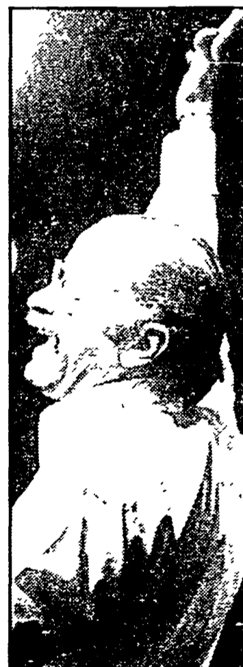
Gino Paoli: «Help» su Canale 5 alle 20,25