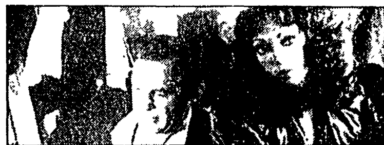
«Assassino di un allibratore cinese» (Raitre, 21,30)

Italia 1 8.30 «La grande vallata», telefilm; 9.30 Film «Piombo rovente»; 11.30 «Maude»; telefilm; 12 «Giorno per giorno»; telefilm; 12.30 «Lucy Shows»; telefilm; 13 «Bim Bum Bam»; cartoni animati; 14 «Agenzia Rockford»; telefilm; 15 «Cannon»; telefilm; 16 «Bim Bum Bam»; cartoni animati; 17.40 «La casa nella prateria»; telefilm; 18.40 «Kung-Fu»; telefilm; 19.50 «Il mio amico Arnold»; telefilm; 20.25 Film «Il prof. dott. Guido Tersilli, primario della clinica Villa Celeste convenzionata con le mutue»; 22.30 Film «La morte risale a ieri sera»; 0.15 «Il presidente»; film Telemontecarlo 13 Olimpiadi; 15 Sport: finale basket F.; 17 Sport: pugilato; 18 «Capitol»; telefilm; 19 Notizie flash; 19.15 Cartoni animati; 19.45 Olimpiadi, sport atletica; 21.30 Sport: pugilato, ciclismo; 22 «Il segno del comando»; sceneggiato, con Ugo Pagliani - Notizie flash Euro TV 13.30 Cartoni animati; 14 «Mama Linda»; telefilm; 19 «Yattamana»; cartoni animati; 19.30 «Mama Linda»; telefilm; 20.20 «Anche i ricchi piangono»; telefilm; 21.20 Film «La storia di Ester Costello»; con Joan Crawford; 23.30 La formula 1 del mare. Rete A 14 «Mariana, il diritto di nascere»; telefilm; 15 «Cara a cara»; telefilm; 16.30 Film «Il mistero della piramide»; con Bud Abbott; 18 «F.B.I.»; telefilm; 19 «Cara a cara»; telefilm; 20 «Angie Girl»; cartoni animati; 20.25 «Mariana, il diritto di nascere»; telefilm; 21.30 Film «Lo, re del blues»; con Roger Mosley; 23.30 Superproposte.