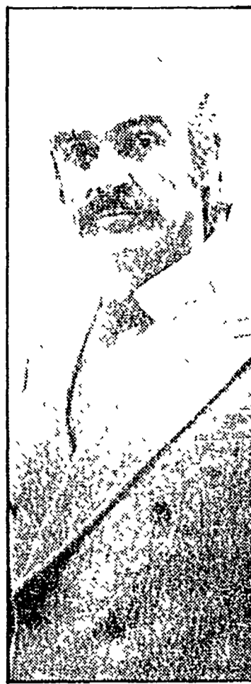
Sean Connery: «Rapina record a New York» (Canale 5, ore 20,25)

23.15 IL BRIVIDO DELL'IMPREVISTO - Telefilm 23.45 TG2 - STANOTTE Raitre 19.00 TG3 - Intervallo con Arago X 001 19.25 X FESTIVAL DELLA VALLE D'ITRIA