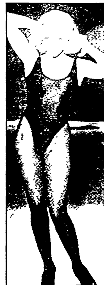
Eleonora Giorgi: «Sotto le stelle» (Raiuno, 20,30)