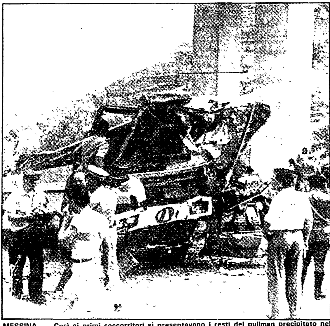
MESSINA — Così si primi soccorritori si presentavano i resti del pullman precipitato nel Messinese