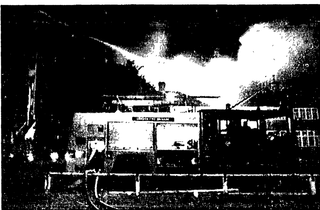
In fumo a Londra 4 milioni di sterline di whiskey

LONDRA — Collisione nella Manica: una nave traghetto-passeggeri, Olav Britannia, in servizio fra Sheerness e Flushing, si è scontrata con un mercantile francese, il Mont Louis, presso la costa del Belgio. Le due navi sono entrate in rotta di collisione precisamente a dodici miglia da Ostenda. Erano circa l'1 e 10 di ieri. Mezzi di soccorso si sono diretti sul posto, ma per ora non è stato possibile un bilancio dell'incidente. Il portavoce della guardia costiera di Dover, che ha raccolto l'SOS delle due navi, ha dichiarato che per il momento non ci sarebbero perdite di vite umane. Le due imbarcazioni sono rimaste incastrate, e si teme che il traghetto Olav Britannia, se disincagliato, colasse a picco.