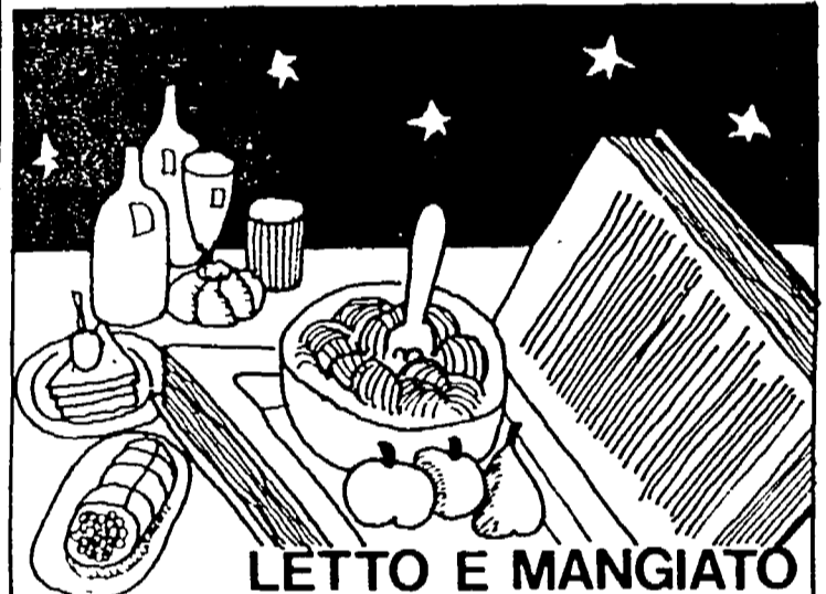
LETTO E MANGIATO