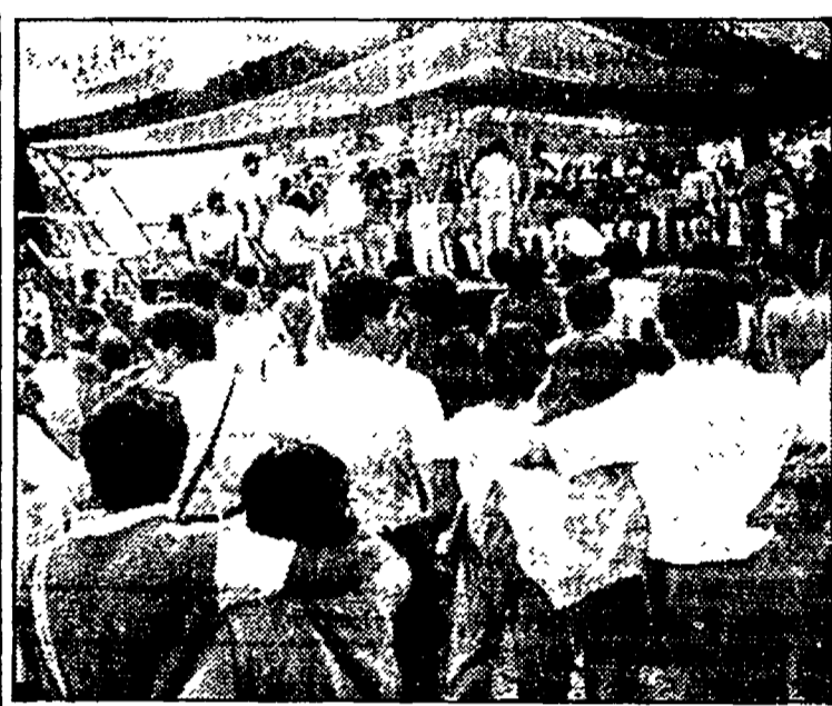
Un concerto dell'anno passato