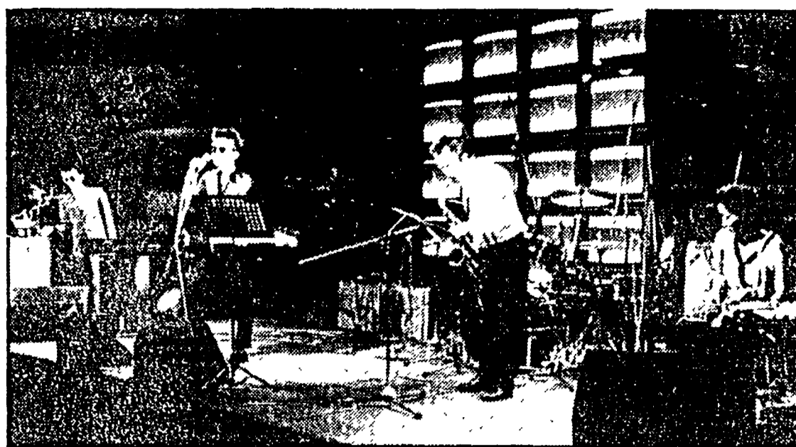
Il Melon, gruppo d'apertura

re semplicemente una formazione di jazz sarebbe riduttivo. I loro spettacoli sono performance complete dove il free jazz si accoppia all'anarchia punk e si estende ancora oltre, mantenendo però omogeneità ed intensità sonora, grazie al forte talento musicale di ogni componente del gruppo. A caratterizzarli è anche l'umorismo delle loro performance, la voglia di giocare coi pubbli-