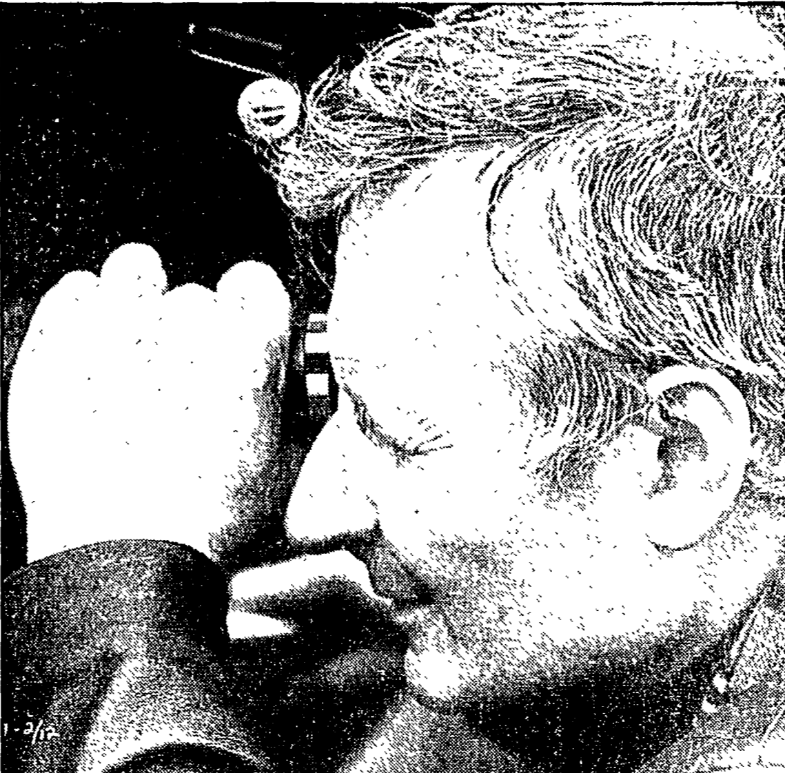
Il regista inglese Lindsay Anderson