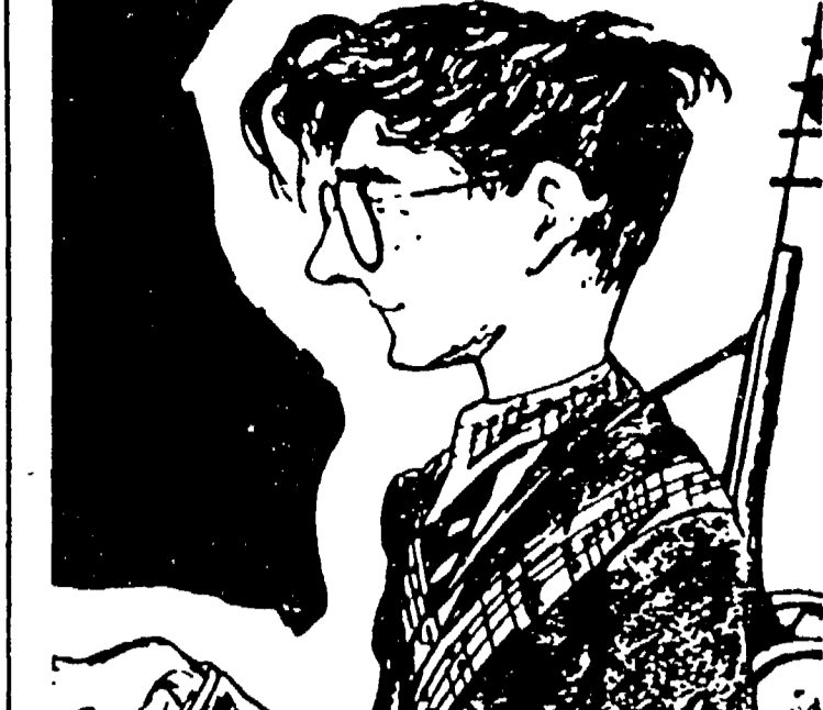
Una caricatura di Sclostokovic

boda il 29 settembre prossimo, nell'ambito di una serie di iniziative tutte finalizzate a mettere in sempre maggior risalto il lavoro di artisti considerati generalmente «complementari» al complesso delle attività sceniche.