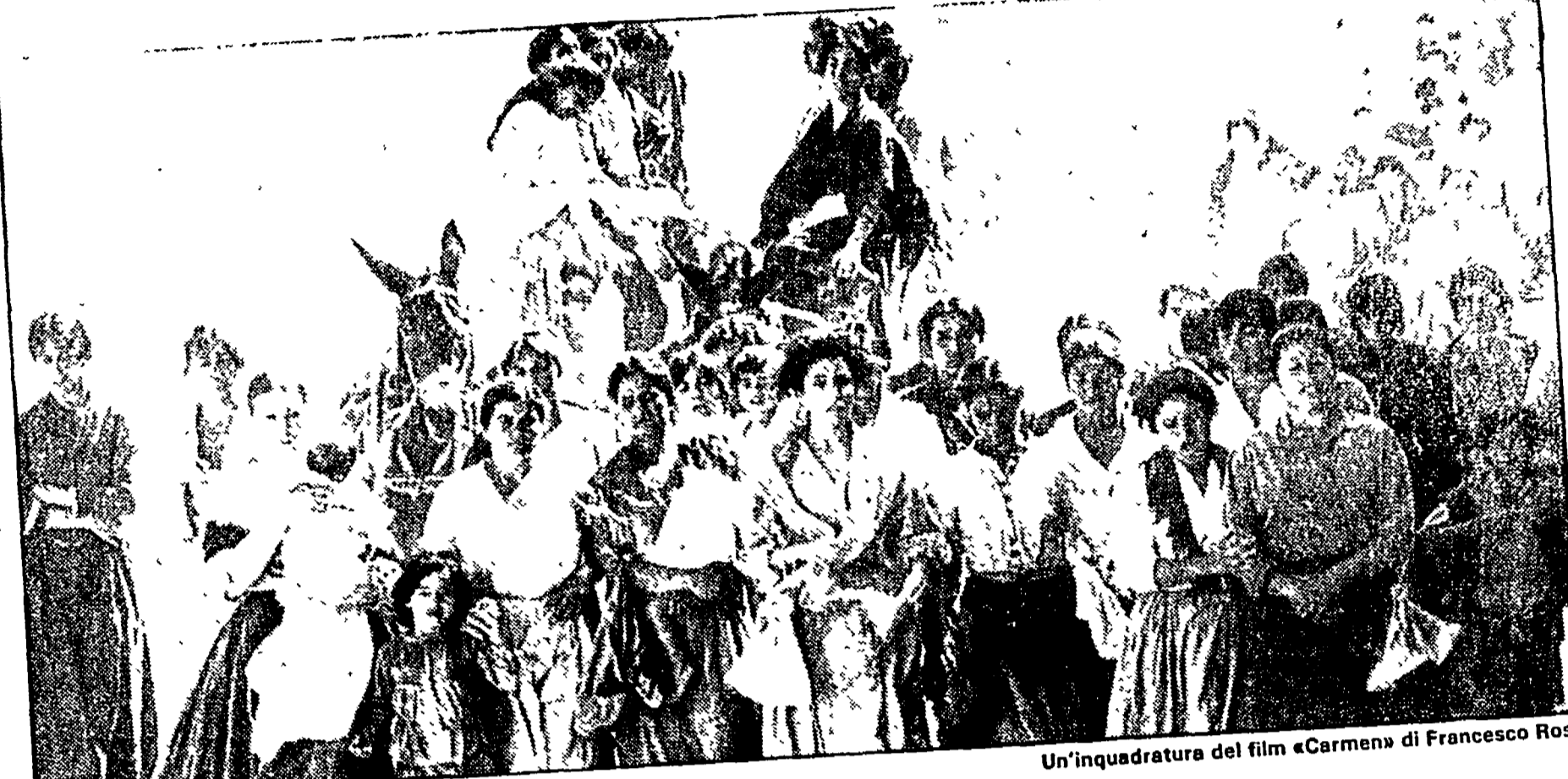
Un'inquadratura del film «Carmen» di Francesco Rosi

Tutti al computer! La Rai ha atteso il televideo per cominciare a parlare il linguaggio binario. Ma ora, all'improvviso, ogni rete ha la sua pagina di informatica.