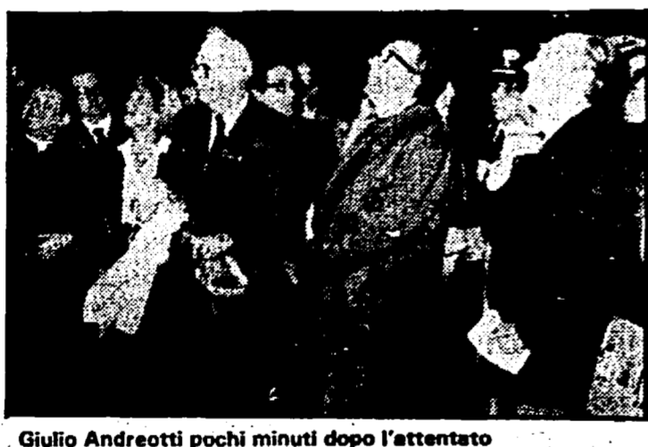
Giulio Andreotti pochi minuti dopo l'attentato

TRIESTE - Un isolato tentativo di aggressione e una sequenza di contestazioni hanno caratterizzato la visita a Trieste del ministro degli Esteri Giulio Andreotti.