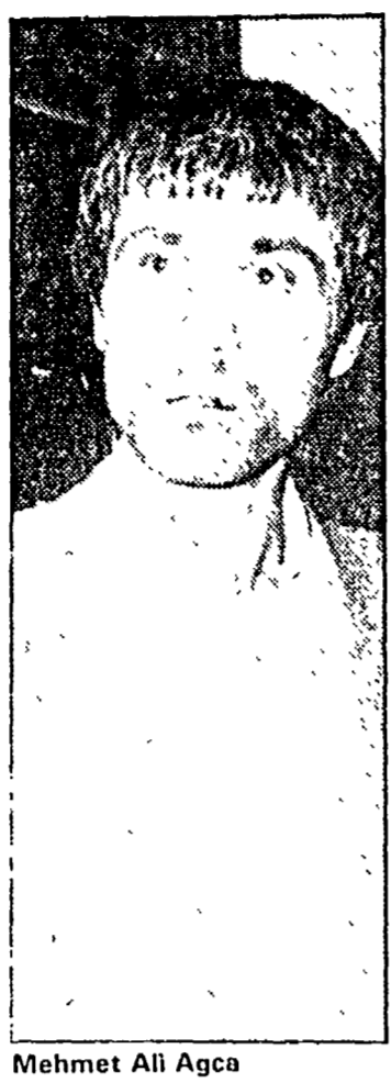
Mehmet Ali Agca