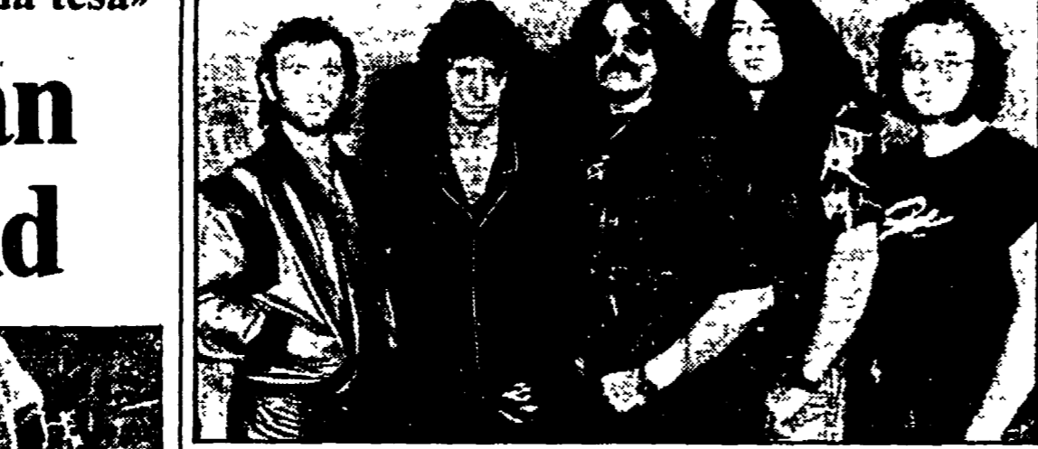
Il gruppo rock del Deep Purple versione 1984