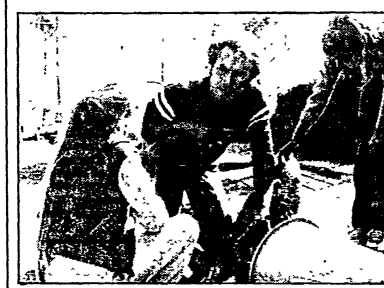
Clint Eastwood in un'inquadratura di «Corda tesa»