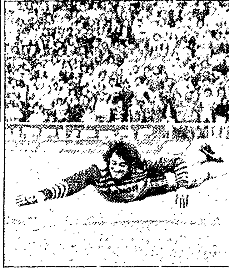
GARELLA uno dei protagonisti del primato veronese

Gli scaligeri, dopo il successo di Torino, sono alla ricerca, contro il Milan, della consacrazione definitiva - Per l'Inter chiacchierona arriva il Napoli