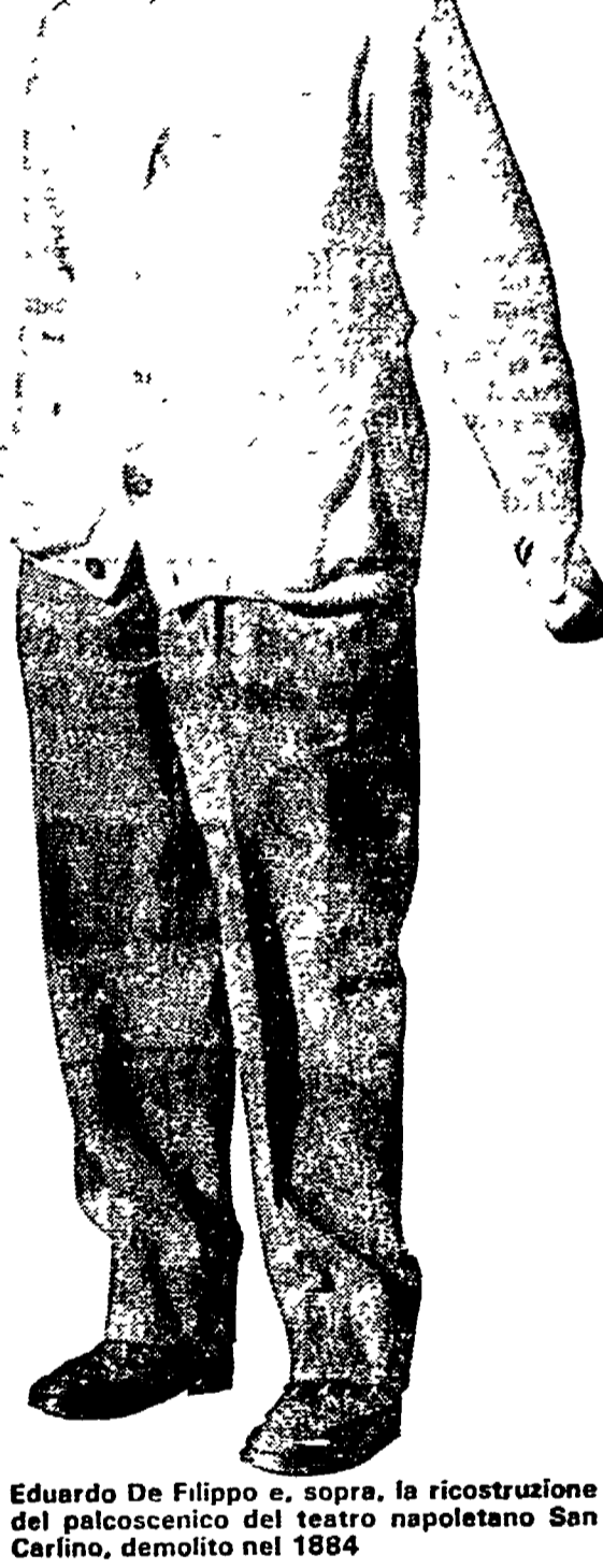
Eduardo De Filippo e, sopra, la ricostruzione del palcoscenico del teatro napoletano San Carlo, demolito nel 1884

Dalla nostra redazione NAPOLI — «...Insomma voglio dire ca' e st'attore sono pature tutte chille ca s'accattano 'o biglietto e traseno, e tutte chille ca trasaranno quando nuie simmo morte tutte quante...»