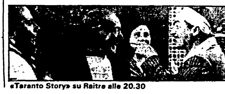
«Taranto Story» su Raitre alle 20.30