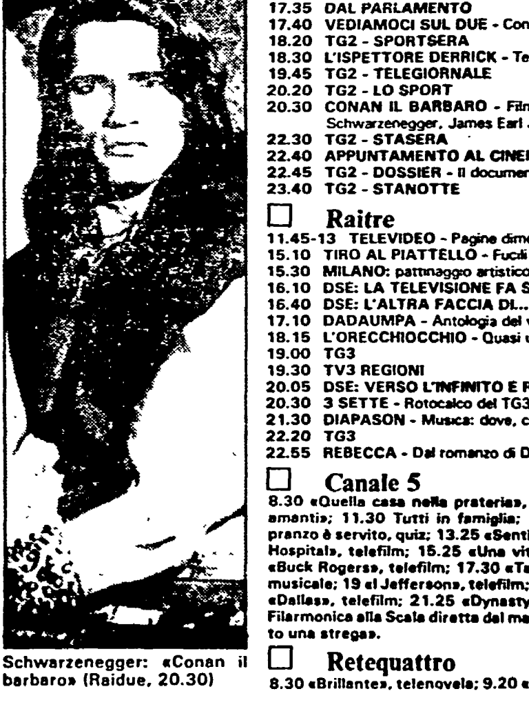
Schwarzenegger: «Conan il barbaro» (Raidue, 20.30)