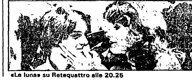
«La luna su Retequattro alle 20.25»