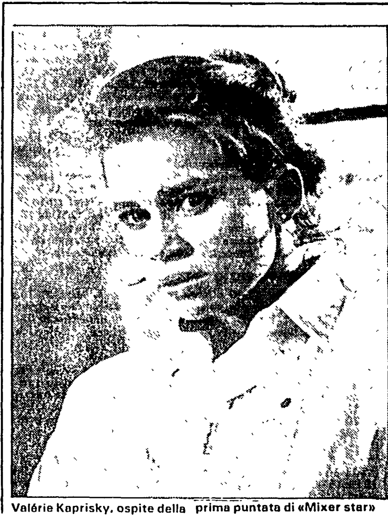
Valérie Kaprisky, ospite della prima puntata di «Mixer star»

Domenica parte su Raidue «Mixer-star», un altro tassello per il programma della seconda rete. «Non vogliamo far concorrenza a Pippo Baudo, ma a Berlusconi»