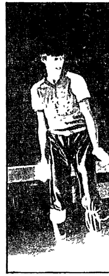
Quattro aspiranti ballerini del «provino» di Raitre