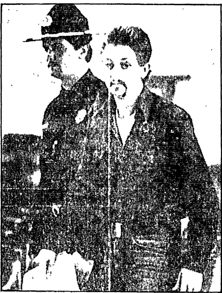
Robert Lee Willie, l'uomo giustiziato

BHOPAL — Un ministro del governo dello stato indiano del Madhya Pradesh ha rassegnato le dimissioni dopo essersi assunto la responsabilità morale della fuga di gas tossici che, settimane or sono, ha causato la morte di 2.500 persone.