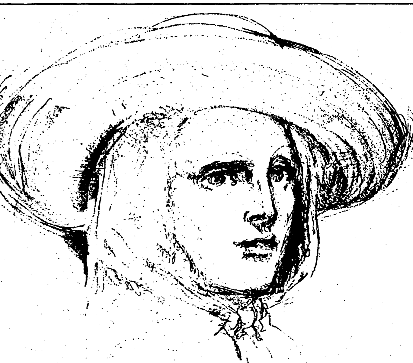
Una cartella per ricordare la bonifica dei braccianti ravennati a Ostia

Sezione Boresti, 1.500.000; sezione R. Gatto, 1.396.600; sezione Alberghini, 1.698.500; sezione Tamara, 345.000; sezione Bertazzini, 2.000.000; sezione Serravalle, 1.000.000; sezione Saletta, 500.000; sezione Curiel (Copparo), 250.000; sezione Lenin