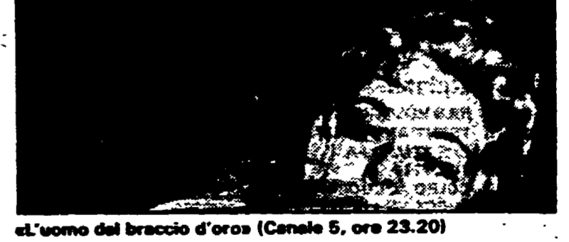
«L'uomo del braccio d'oro» (Canale 5, ore 23.20)

19.30, 22.30; 61 giorni; 7.20 Parole di vita; 8 DSE: Infanzia, come e perché...; 8.45 Don Mazzioli: una vita in prestito; 9.10 Discogame; 10 Speciale GR2 sport; 10.30 Aprimo i regali; 12.10-14 Programmi regionali; GR2 regionali; 12.45 Tutto è un gioco; 15 «Accu amara di Prandio»; 15.30 GR2 Economia; 15.42 Omibus; 18.32 La ore della musica; 19.50 Speciale GR2 Cultura; 23.10 Bollettino del mattino; 11 Ora edb; 11.48 Succede in Italia; 12 Pomeriggio musicale; 15.30 GR2 Cultura; 15.30 Un certo discorso; 17 DSE: Viaggio dentro le istituzioni; 17.30-15 Spazio Tre; 21 Rassegna delle riviste; 21.10 Il centenario della nascita di Bach; 22.20 Montecarlo; 22.30 Nuova musica; 23.05 Il jazz; 23.40 Il racconto di mezzanotte.