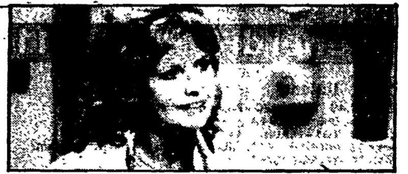
«General Hospital» su Canale 5 alle 14.25