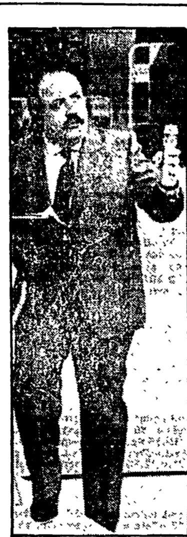
«Buona domenica» su Canale 5 alle 13.30