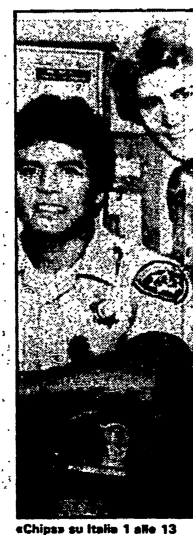
«Chippa» su Italia 1 alle 13