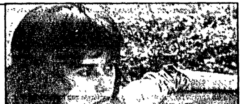
«Cercasi Gesù» su Retequattro alle 20.25