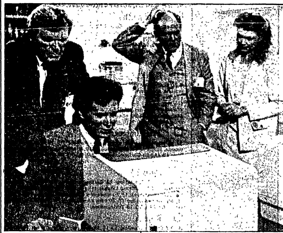
Una inquadratura di «Automan»