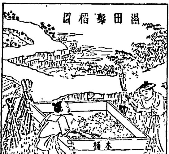
Tempo di riformatori audaci. Qui si parla di Shang Yang. Colui che dopo un lungo periodo di attente considerazioni su una solida base ideologica, promulga riforme volte a modificare le leggi, rivedere il codice penale, incoraggiare l'agricoltura all'interno, fare un buon lavoro nel premiare e punire. Solo che Shang Yang non è un ministro dei giorni nostri.

«Nei tempi antichi se un politico voleva riuscire doveva avere un buon rapporto con chi regnava, ovvero il problema della identità ideologica»