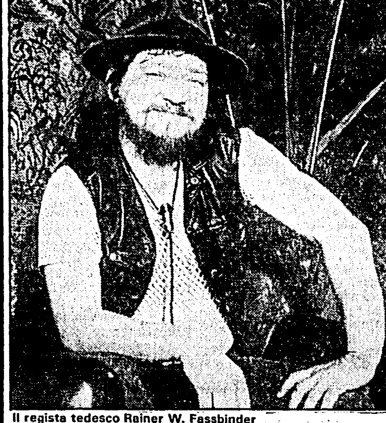
Il regista tedesco Rainer W. Fassbinder

Dalla morte di Rainer W. Fassbinder sono passati due anni e mezzo: tanti o pochi? Tanti o pochi, c'è da chiedersi, soprattutto, per il cinema tedesco che ne ha raccolto l'eredità, ma ne ha anche avvertito il vuoto.