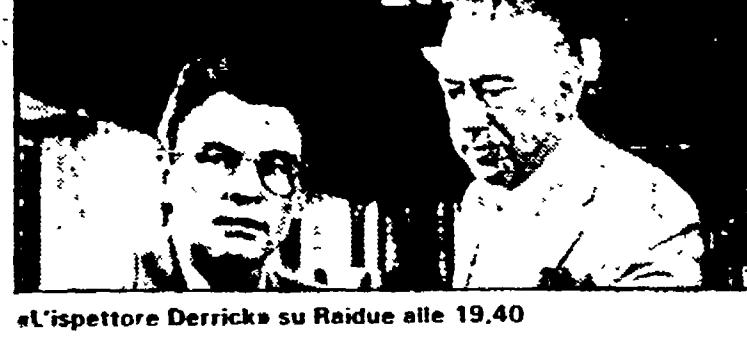
«L'ispettore Derricks» su Raiuno alle 19.40

Italia 1 8.30 «La grande vallata», telefim; 9.30 Film «Il grande amore di Elisabetta Barreta»; 11.30 «Sanford and Sons», telefim; 12 «Agenzia Rockford», telefim; 13 «Angeli volanti», telefim; 14 «Bim Bum Bam»; 17.40 Musica 4, 18.40 «Squadra anticrimine», telefim; 19.50 Cartoni animati, 20.30 «Automan», telefim; 21.30 «L'azzardo», telefim; 22.30 «Il principe delle stelle», telefim; 23.30 Deejay Television - Video Music Non Stop.