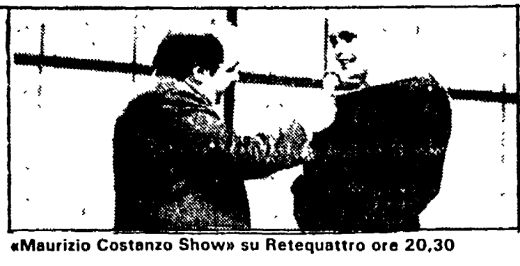
«Maurizio Costanzo Show» su Retequattro ore 20.30

Italia 1 8.30 «La grande vallata», telefim; 9.30 Film «Destino in agguato»; 11.30 «Sanford and Sons», telefim; 12 «Agenzia Rockford», telefim; 13 «Chips», telefim; 14 Deejay Television; 14.30 «La famiglia Bradford», telefim; 15.30 «Sanford and Sons», telefim; 16 «Bim Bum Bam»; 17.45 «La donna bionica»; 18.45 «Charlie's Angels», telefim; 19.50 Il giro del mondo di Willy Fog; 20.30 «Al giorno di Briani», telefim; 17.15 «In casa Lawrence», telefim; 18.05 «Febbre d'amore», telefim; 18.55 «Samba d'amore», telenovela; 19.25 «M'am non m'ama», gioco; 20.30 Maurizio Costanzo Show; 23 «La città degli angeli», sceneggiato; 24 Film «Il tempo si è fermato» (Farrow).