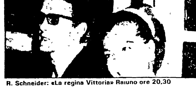
R. Schneider: «La regina Vittoria» Raiuno ore 20.30

Italia 1 8.30 «La grande vallata», telefim; 9.30 Film «La rossa»; 11.30 «Sanford and Sons», telefim; 12 «Agenzia Rockford», telefim; 13 «Chips», telefim; 14 Deejay Television; 14.30 «La famiglia Bradford», telefim; 15.30 «Sanford and Sons», telefim; 16 «Bim Bum Bam»; 17.45 «La donna bionica»; 18.45 «Charlie's Angels», telefim; 19.50 Il giro del mondo di Willy Fog; 20.30 Film «Andromeda»; 22.30 Servizi speciali di Italia 1; 23 Film «Ultimo domicilio conosciuto»; 1 «Mod Squad i ragazzi di Greer», telefim.