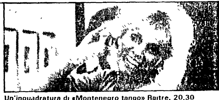
Un'inquadratura di «Montenegro tango» Raitre, 20.30

Italia 1 8.30 «La grande vallata», telefim; 9.30 Film «Figli e amanti»; 11.30 «Sanford and Sons», telefim; 12 «Agenzia Rockford», telefim; 13 «Chips», telefim; 14 Deejay Television; 14.30 «La famiglia Bradford», telefim; 15.30 «Sanford and Sons», telefim; 16 «Bim Bum Bam»; 17.45 «La donna bionica»; 18.45 «Charlie's Angels», telefim; 19.50 Il giro del mondo di Willy Fog; 20.30 Film «Britannia Hospital»; 22.30 «Cin cina», telefim; 23 Film «C. Czapka»; 0.30 Film «Il terrore di Frankenstein»; 1.45 «Mod Squad i ragazzi di Greer», telefim.