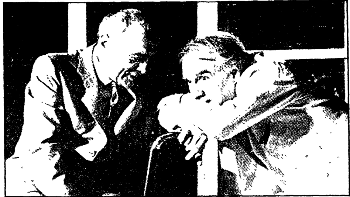
Luigi Pistilli e Giorgio Albertazzi ne «Il Genio»

La scorsa domenica avevamo annunciato il concerto di formazione inglese «Lords of the new church», che si sarebbe dovuto tenere il lunedì presso il «Piper club».