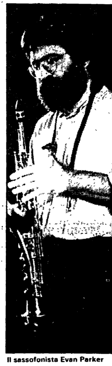
Il sassofonista Evan Parker

La scorsa domenica avevamo annunciato il concerto di formazione inglese «Lords of the new church», che si sarebbe dovuto tenere il lunedì presso il «Piper club».