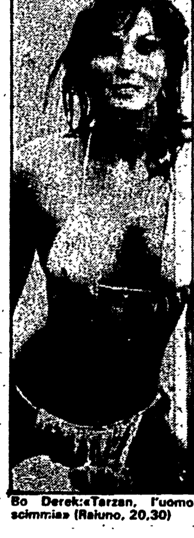
Bo Derek: «Tarzan, l'uomo scimmia» (Raiuno, 20,30)