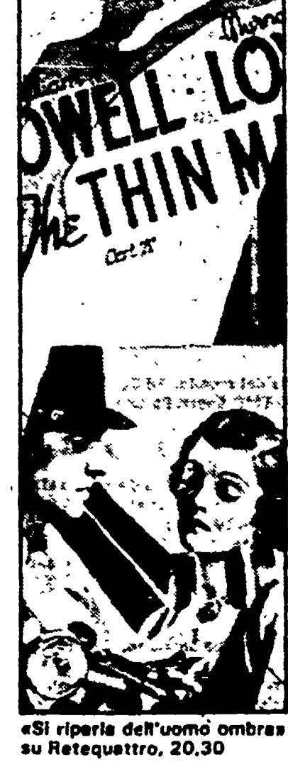
«Chi riparla dell'uomo ombra» su Retequattro, 20,30