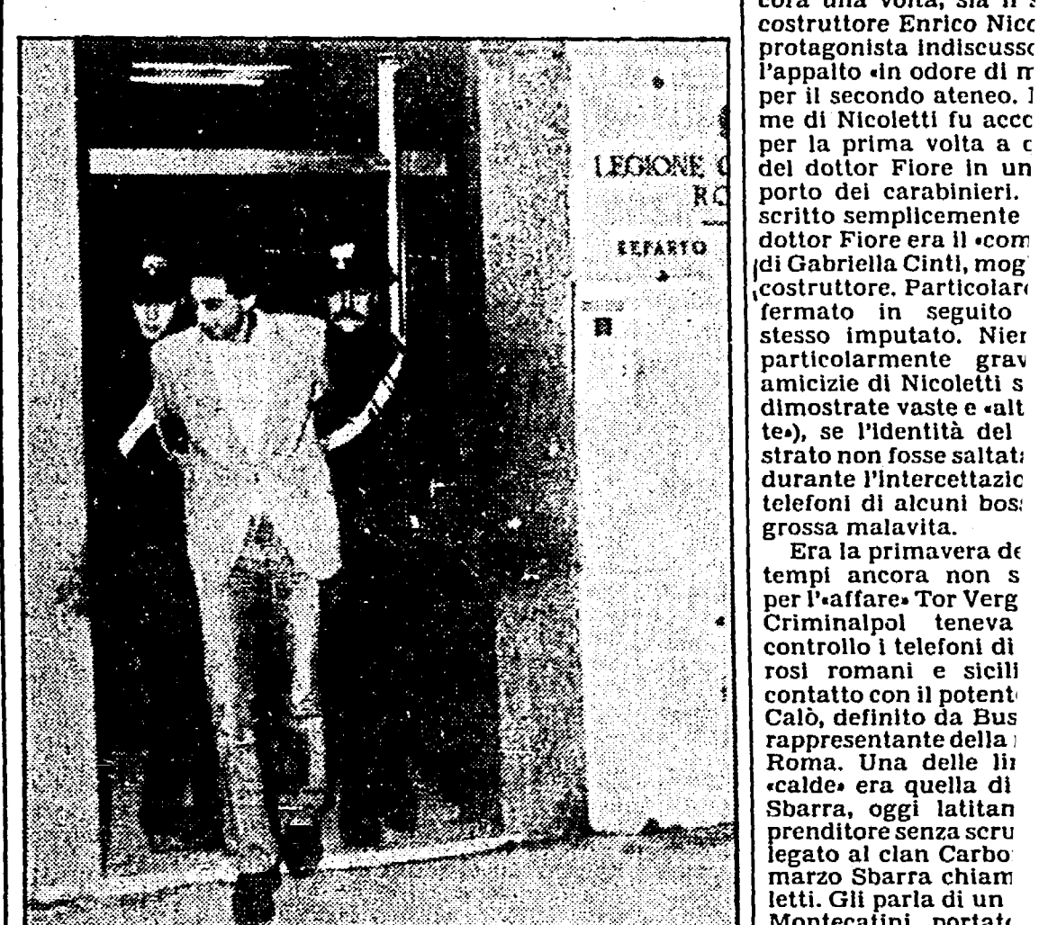
Arrestato boss della 'ndrangheta

vere per conto proprio e sulla testa dei cittadini i problemi di una grande capitale come Roma. Non dimentichiamo tra l'altro che Roma, come cento altre città d'Italia, ma in misura forse maggiore di ogni altra, è una città che ama discutere, litigare e che non accetta imposizioni dall'alto.