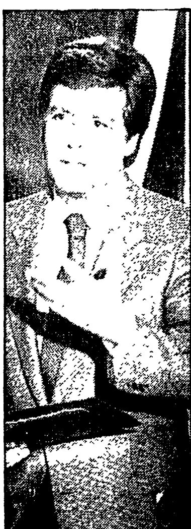
Claudio Lippi: «Tutti in famiglia» (Canale 5, ore 11.30)

10.00 TELEVIDEO - Pagine dimostrative 11.55 CHE FAI, MANGI? - Conduce Enzo Sampò 13.00 TG2 - ORE TREDICI 13.25 TG2 - AMBIENTE 13.30 CAPITOL - Serie televisiva (214ª puntata) 14.30 TG2 - FLASH 14.35-16 TANDEN - Super G, attualità, giochi elettronici 16.10 UN CARTONE TRA L'ALTRO - Yakari 16.25 DSE: UNA SCIENZA PER TUTTI 16.55 DUE E SIMPATIA - Il consigliere imperiale (6ª puntata) 17.30 TG2 - FLASH