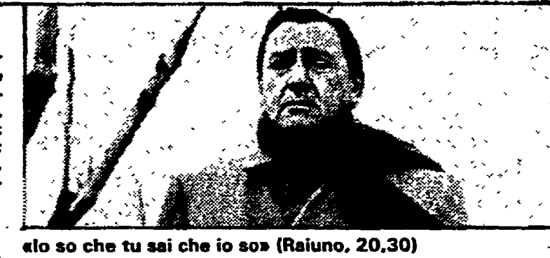
«Io so che tu sai che io so» (Raiuno, 20.30)

8.30 «Accendi un'amica»; 13.15 «Accendi un'amica special»; 14 Film «Mi piace quella bionda»; 16 «Il tempo della nostra vita», telefilm; 17 «Al 96», telefilm; 17.30 «Dhe Doctors», telefilm; 18 Cartoni animati; 18.30 «Aspettando il domani», sceneggiato; 19.30 «Mariana, il diritto di nascere», telefilm; 20.25 «Dancing Days», telefilm; 21.30 «Contra-to martellante», film; 22.30 Film «L'ossessione del passato».