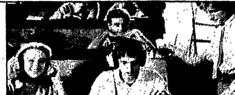
«Inferno» (Raitre alle 20.30)

8.15 Accendi un'amica; 13.15 Accendi un'amica special; 14 Film «Mi piace quella bionda»; 16 «Il tempo della nostra vita», telefilm; 17 «Al 96», telefilm; 17.30 «Dhe Doctors», telefilm; 18 Cartoni animati; 18.30 «Aspettando il domani», sceneggiato; 19.30 «Mariana, il diritto di nascere», telefilm; 20.25 «Dancing Days», telefilm; 21.30 «Contra-to martellante», film; 22.30 Film «L'ossessione del passato».