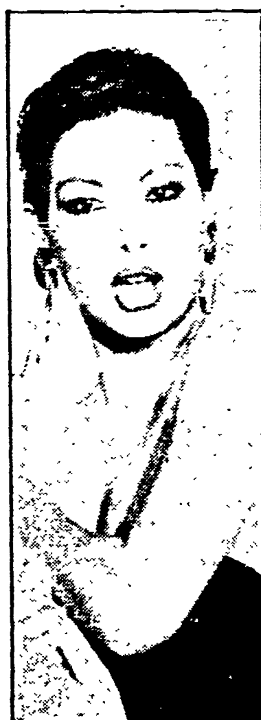
Edwige Fenech: «Risatissima» (Canale 5, ore 20.30)

10.00 GIORNI D'EUROPA 10.30 PROSSIMAMENTE - Programmi per sette sere 10.45 LA MOGLIE IDEALE - Con Nando Gazzolo 12.00 TG2 - STARY - Muoversi come e perché 13.00 TG2 - ORE TREDICI 13.25 TG2 - I consigli del medico. A cura di Luciano Onder 13.30 TG2 - BELLA ITALIA - Città, uomini e cose da difendere 14.00 DSE: SCUOLA APERTA 14.30 TG2 - FLASH 14.35 ESTRAZIONI DEL LOTTO 14.40 LA CROCE DI LORENA - Film con Gene Kelly, Jean-Pierre Aumont 16.10 SERENO VARIABLE - Turismo, Spettacolo e Calcosmo