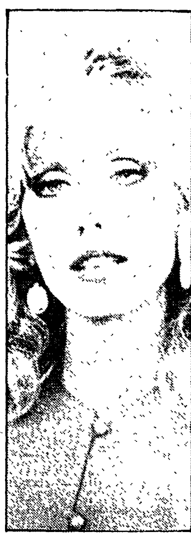
Morgan Fairchild: «Fleming Road» (Retequattro, 17.05)

8.30 «Papà, caro papà», telefilm; 8.50 «Brillante», telenovela; 9.40 «Fleming Road», telefilm; 10.30 «Alice», telefilm; 10.50 «Mary Tyler