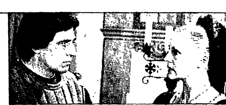
«Sul set di Cristoforo Colombo», (Raidue, ore 22.20)

GIORNALI RADIO: 6.45, 7.25, 9.45, 11.45, 13.45, 15.15, 18.45, 20.45, 23.53. 6 Preludio; 6.55 Concerto del mattino; 7.30 Prima pagina; 8.30 Concerto del mattino; 10 L'Odissea di Omero; 10.25 Concerto del mattino; 11.48 Succede in Italia; 12 Pomeriggio musicale; 15.30 Un certo discorso; 17 Spazio Tre; 19 Spazio Tre; 21 Rassegna delle riviste; 21.10 Nuove musiche; 21.45 Capitalismo e civiltà materiale; 22 La stragrande; 23.30 Amarcord; 23.45 La tua voce; 23.50 Il racconto di mezzanotte.