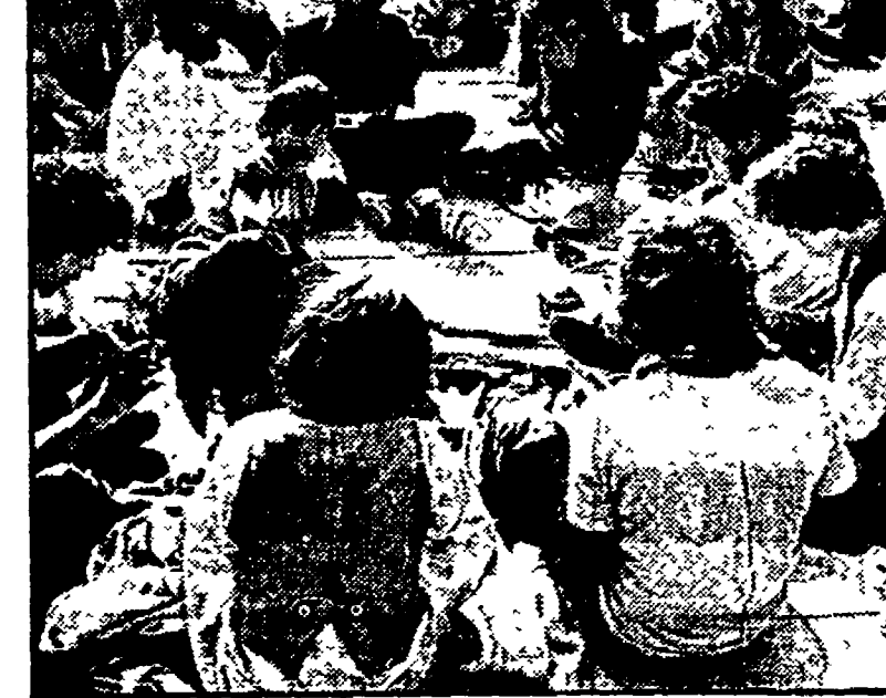
«Ma attenzione a non perdere di vista le condizioni materiali e politiche», ha detto Ingrao. Gli imprenditori, i manager, i politici, alzano la bandiera del dominio assoluto dell'impresa.