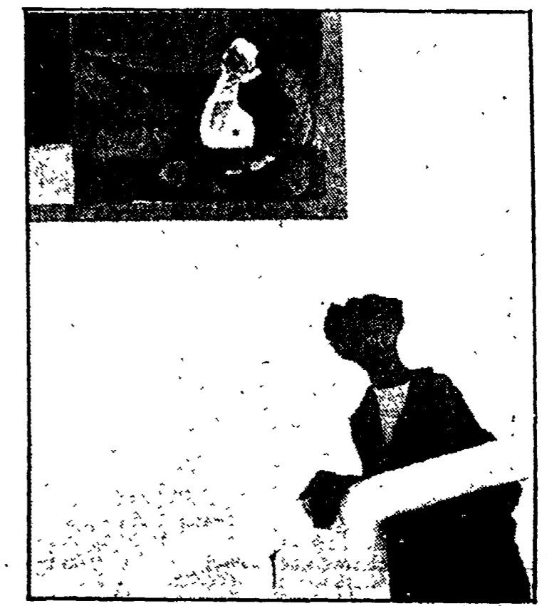
Jaber: particolare di «Uscita dal museo»

Tagli e cerchi di cielo, nuvole a strisce