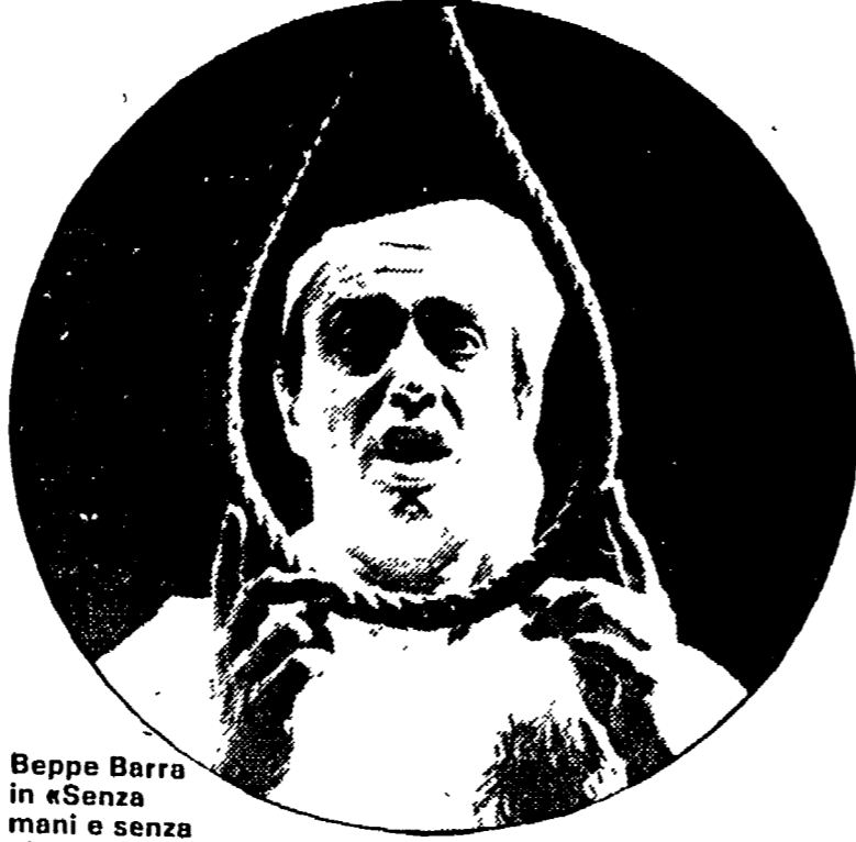
Beppe Barra in «Senza mani e senza piedi»