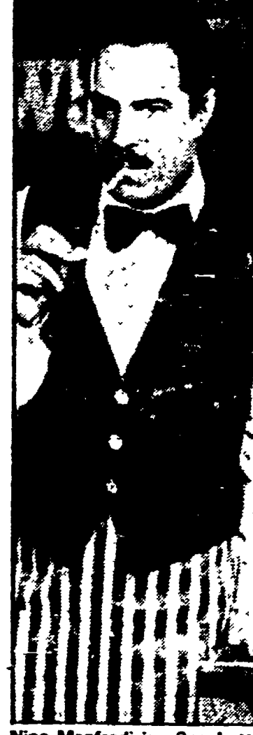
Nino Manfredi in «Spaghetti House» (Canale 5, 21,30)