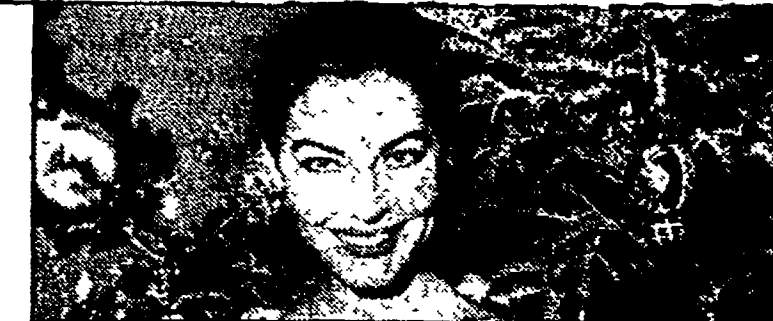
Ava Gardner: «La contessa scalza» (Raiuno, 20,30)