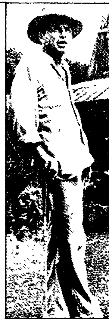
Frank Sinatra: «Il diavolo alle quattro» (Retequattro, 20,30)