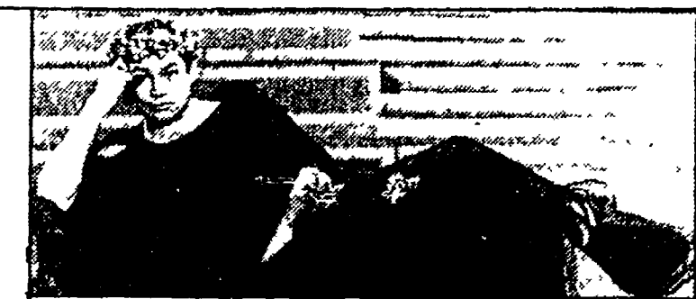
Brandauer in «Quo Vadis?» (Raiuno, 20,30)