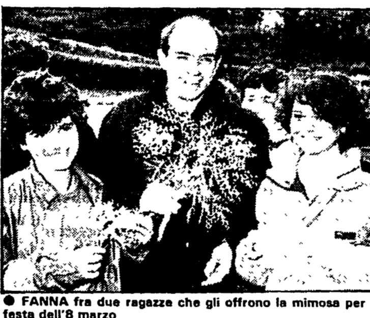
FANNA fra due ragazze che gli offrono la mimosa per la festa dell'8 marzo