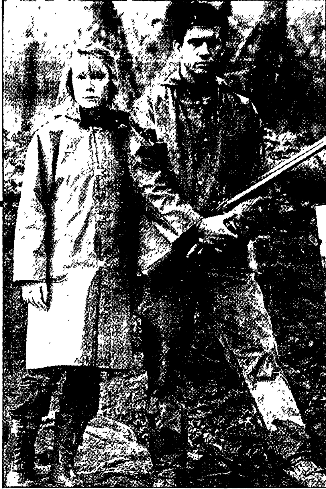
Mel Gibson e Sissy Spacek ne «Il fiume dell'ira» di Mark Rydell e, accanto, il regista