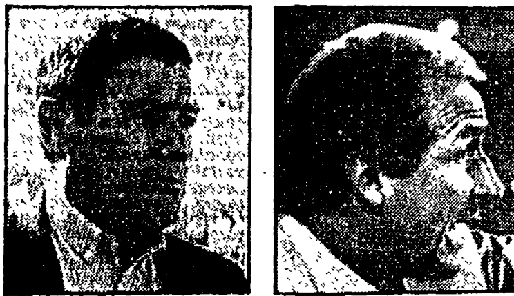
● RADICE ● TRAPATTONI