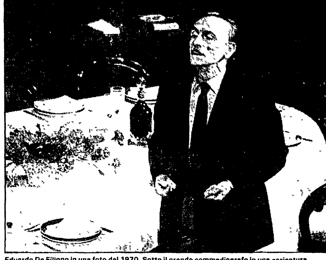
Eduardo De Filippo in una foto del 1970. Sotto il grande commediografo in una caricatura

Il convegno A Milano critici, registi, storici, attori hanno valutato la sua eredità umana e teatrale. E adesso Strehler riporta in scena «La grande magia»