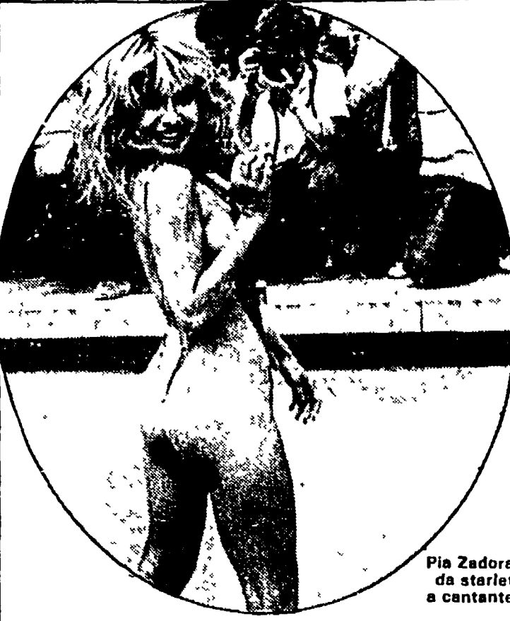
Pia Zadora da starlet a cantante

ROMA — Al «paese del sol levante» è dedicata un'ampia panoramica sul teatro, il cinema sperimentale e la più recente produzione di video e di moda raccolta sotto il titolo «Giappone, avanguardia del futuro» che prenderà il via il 26 aprile a Genova allestita tra i carrugi della città vecchia e negli antichi e sontuosi palazzi del centro storico. Le mostre che si vedranno sono oltre una decina: dalle ultime produzioni del più grande illustratore giapponese, Tadanori Yokoo, alle fantastiche creazioni «sexi-robot» del disegnatore Hajime Sorayama; dalle preziose olografie ad acqua della giovane Setsuko Ishii alla complessa installazione in video, specchi e laser di Katsuhiko Yamaguchi, maestro nell'arte di trasformare in spettacolo le nuove tecnologie.