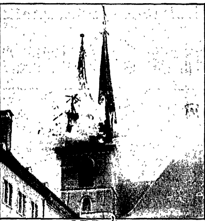
In fiamme la Cattedrale La Cattedrale di Notre Dame di Lussemburgo, meta di Giovanni Paolo II nella sua prossima visita nel Granducato (15 e 16 maggio), è stata danneggiata ieri da un incendio che ha distrutto una delle due guglie.

GINEVRA — La Croce rossa internazionale ha reso noto che il Somalia il colera ha già fatto mille morti e che oltre 300.000 persone sono minacciate dall'inferno. L'organizzazione internazionale ha denunciato il numero dei nuovi casi di colera aumenta, mentre è in diminuzione il numero dei decessi.