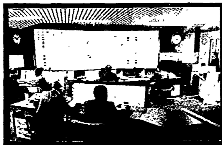
A cura della Divisione Autonoma Relazioni Aziendali