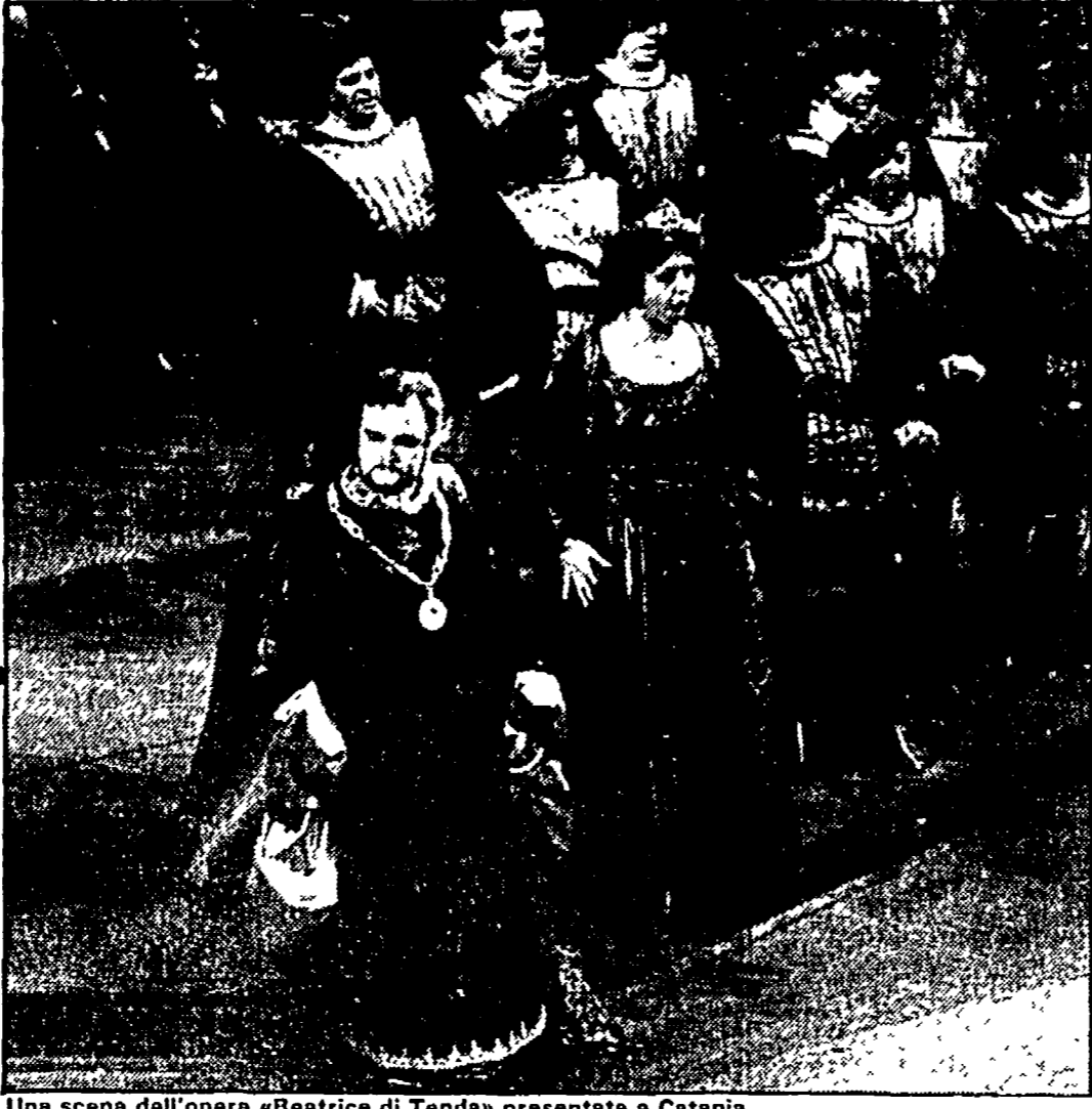
Una scena dell'opera «Beatrice di Tenda» presentata a Catania