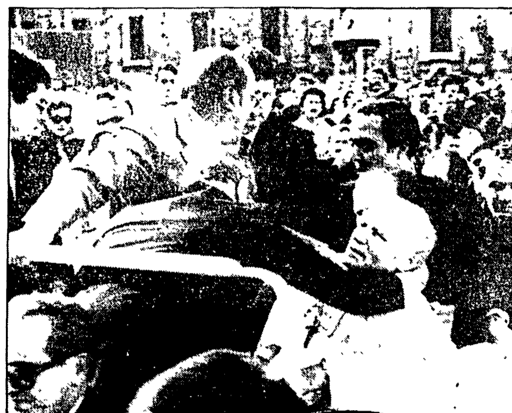
Nella foto in alto: Giovanni Paolo II è appena stato colto. Al centro: Serghy Antonov. In basso: sopra il luogo in piazza San Pietro con Ali Agca.