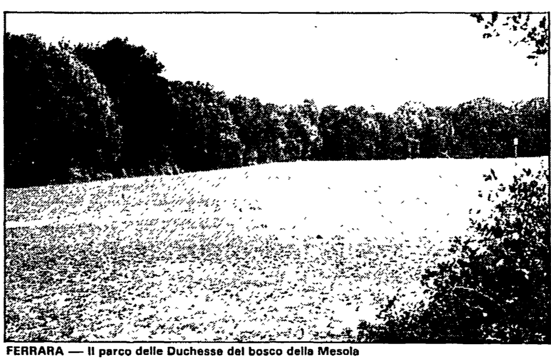
FERRARA - Il parco delle Duchesse del bosco della Mesola

Conseguenze disastrose dal prosciugamento della Valle Falco - Ora un progetto della Regione farà riallagare il Boscone